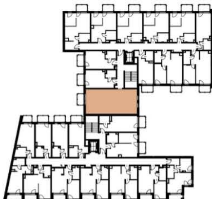
Położenie lokalu w budynku