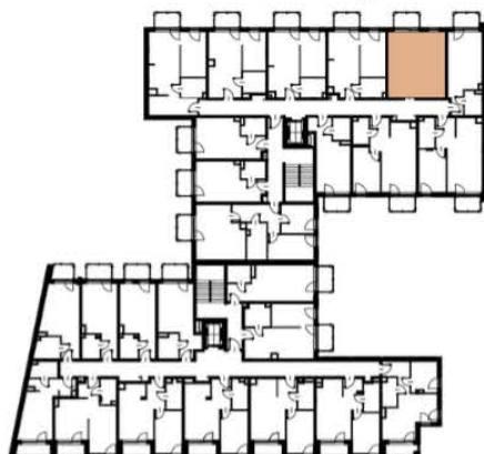
Położenie lokalu w budynku