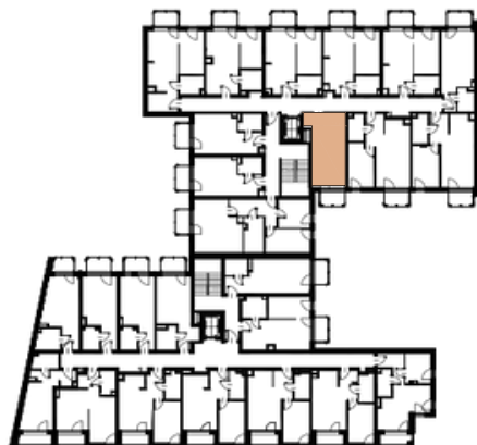
Położenie lokalu w budynku